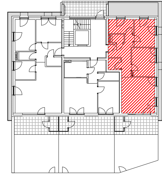
LAGE IM GEBÄUDE B3 ERDGESCHOSS