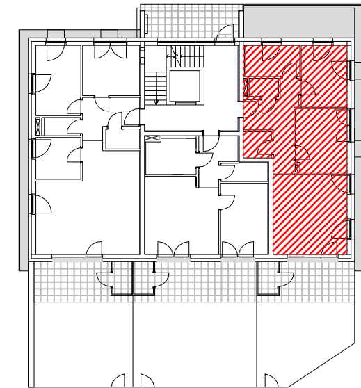
LAGE IM GEBÄUDE B5 ERDGESCHOSS