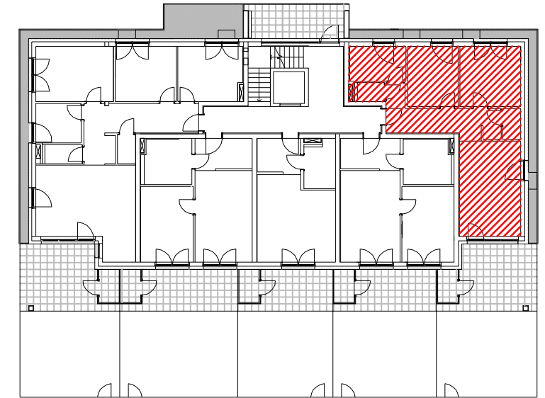
LAGE IM GEBÄUDE A1 ERDGESCHOSS