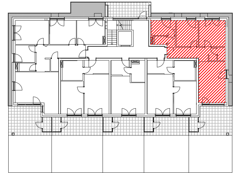
LAGE IM GEBÄUDE A2 ERDGESCHOSS