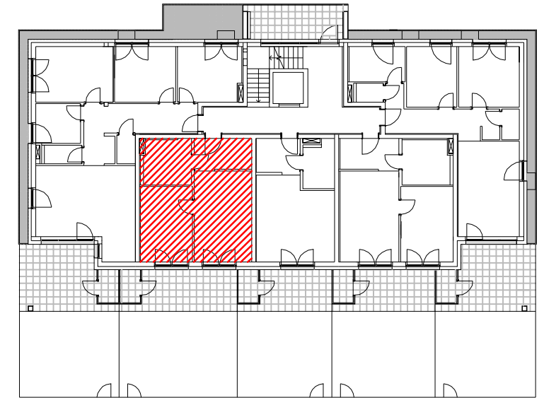
LAGE IM GEBÄUDE A1 ERDGESCHOSS