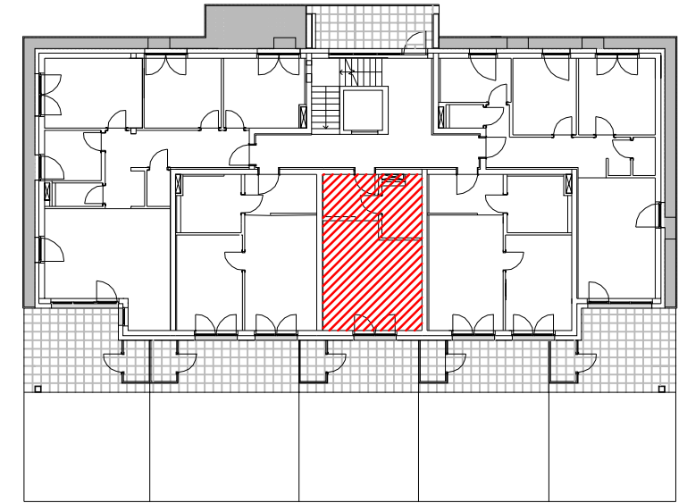
LAGE IM GEBÄUDE A2 ERDGESCHOSS